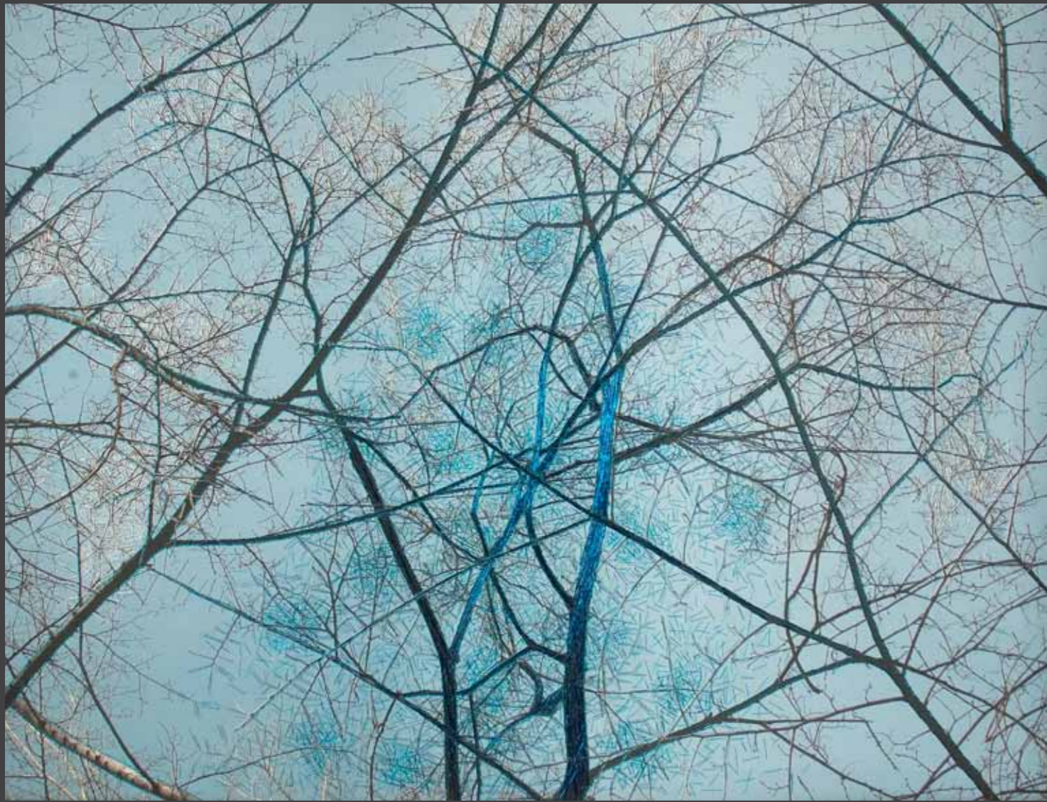
Respiración 117 x 100 cm