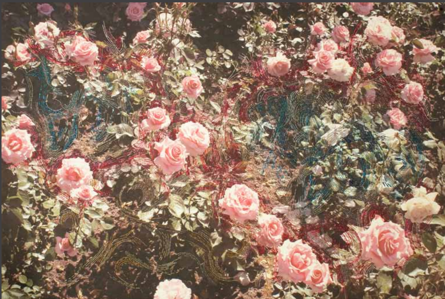
Táctil 120 x 80 cm