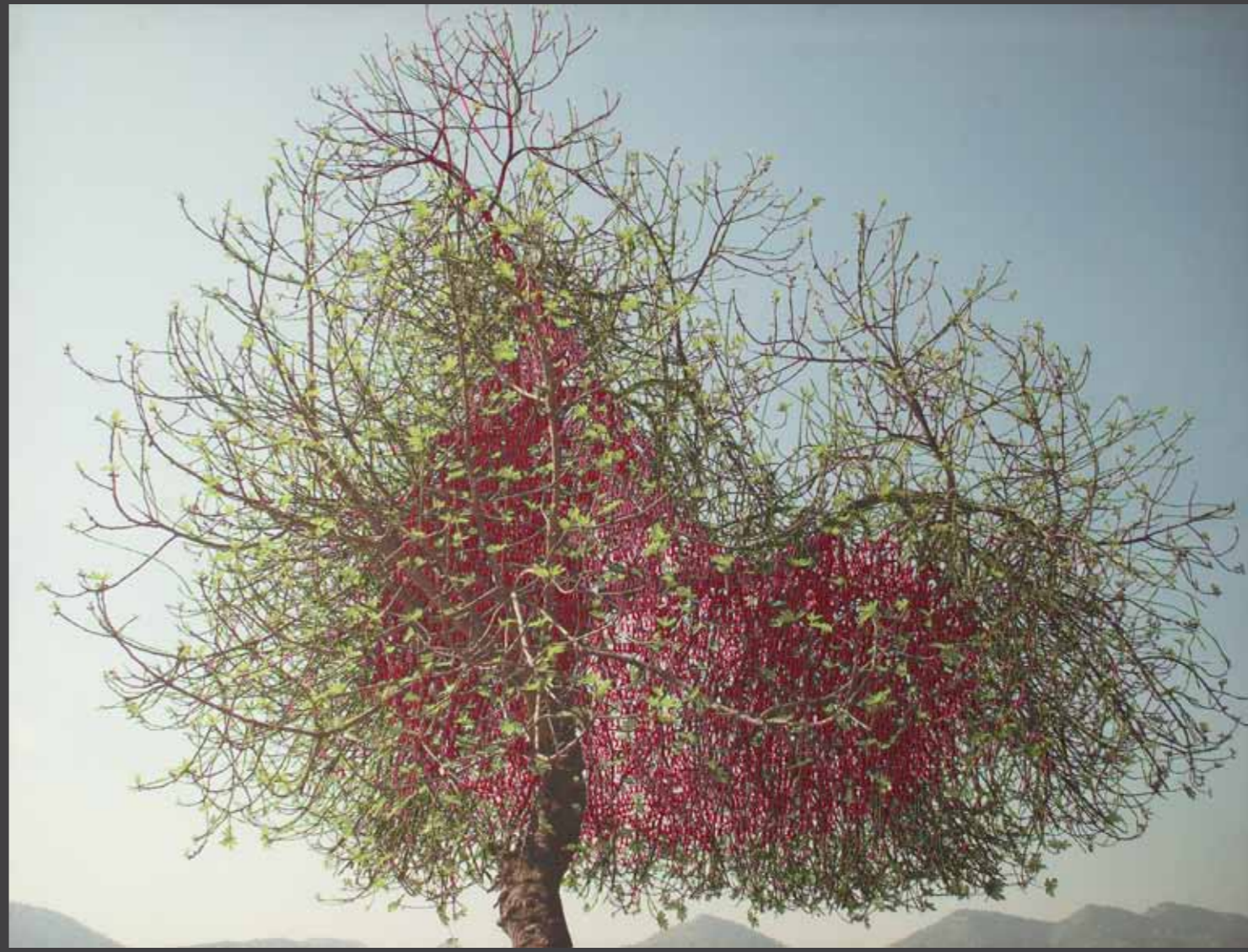
Organismo 130 x 97 cm